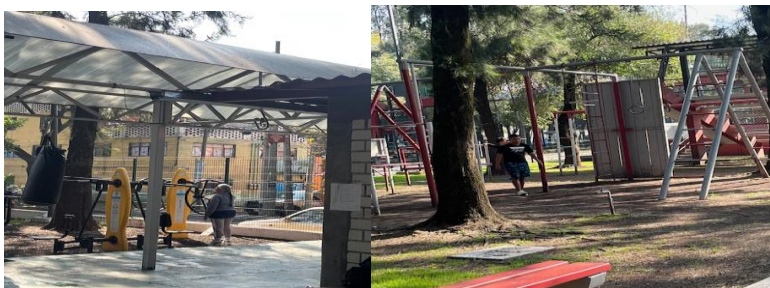
Lugar: Centro Social “Miravalle” en “Ramos Millan” Actividades: palapas