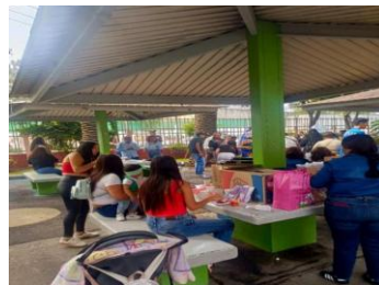
Lugar: Centro Social “Leopoldo Ensastiga” en “Ramos Millan” Actividades: palapas, cancha de futbol rapido