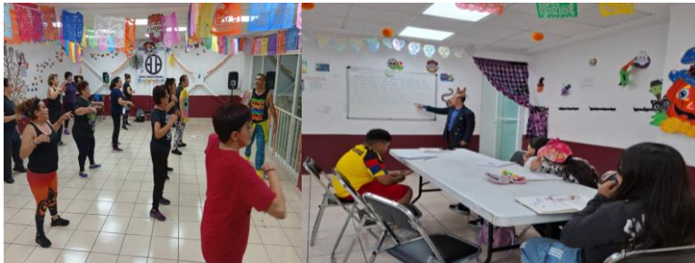
Lugar: Centro Social “Parque Acteal” en Ramos Milla Actividades: futbol, palapas